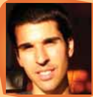
Julien Gagnon du 12 avril au 7 juin, 2010 Lundi 19h - 20h30

(le prix comprend la taxe et la location d'un tapis de yoga)