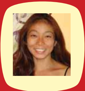
Sheryl Hoo du 27 mars au 15 mai, 2012 les mardis du 18h - 19:30