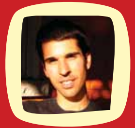
Julien Gagnon du 19 mars au 14 mai, 2012 les lundis du 19:15 - 20:45

(le prix comprend la taxe et la location d'un tapis de yoga)